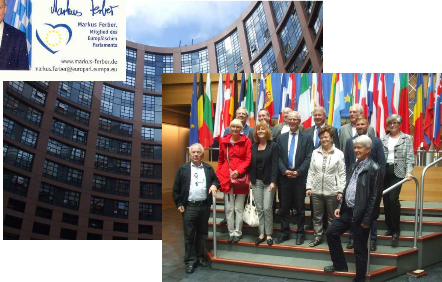
Exkursion nach Straßburg Besuch Europaparlament 06.- 07. September 2015