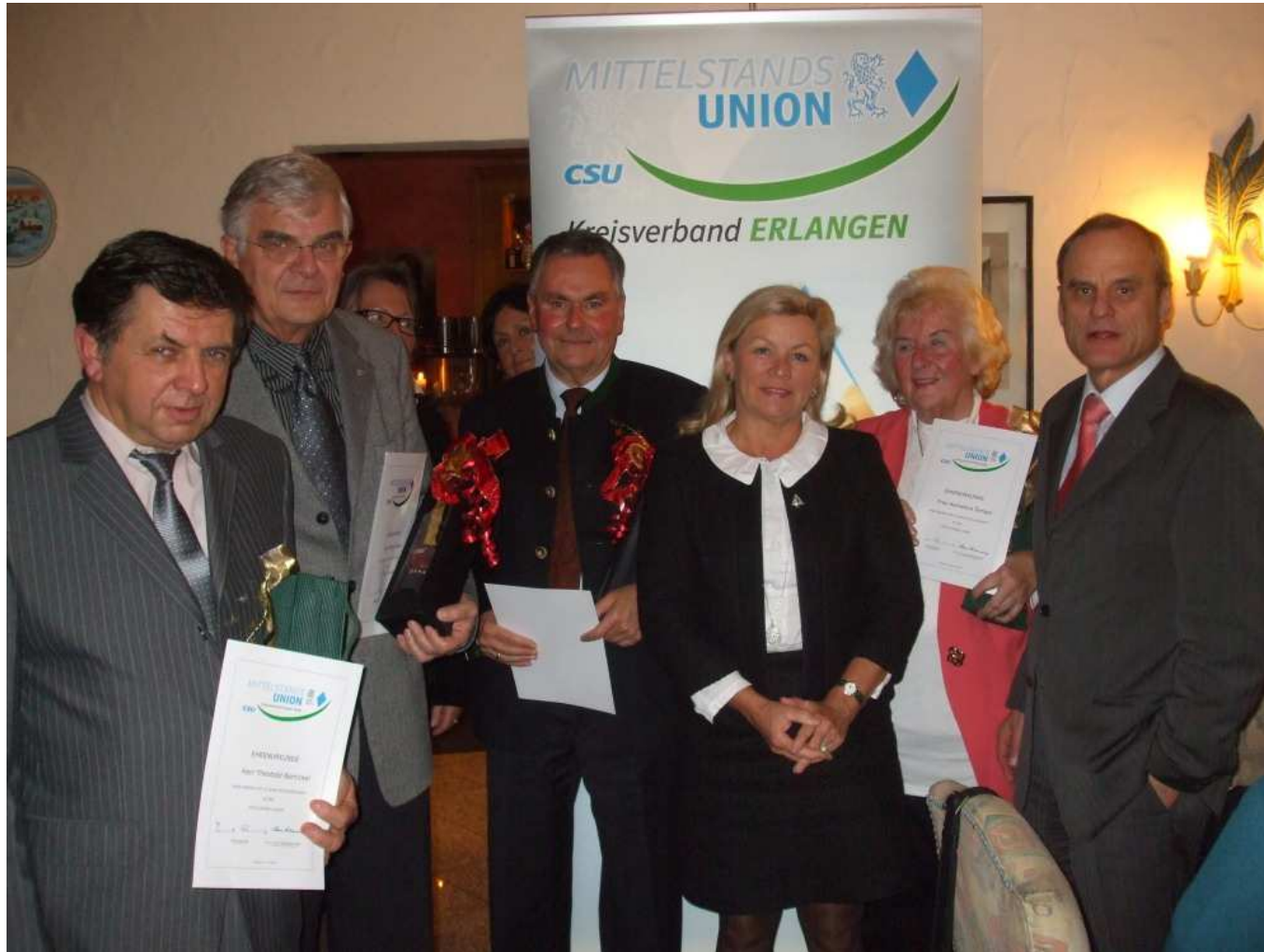
1. Dezember 2009 im Restaurant "Rauchfang" Mittelstandsunion ehrt Mitglieder für ihre langjährige Mitgliedschaft.