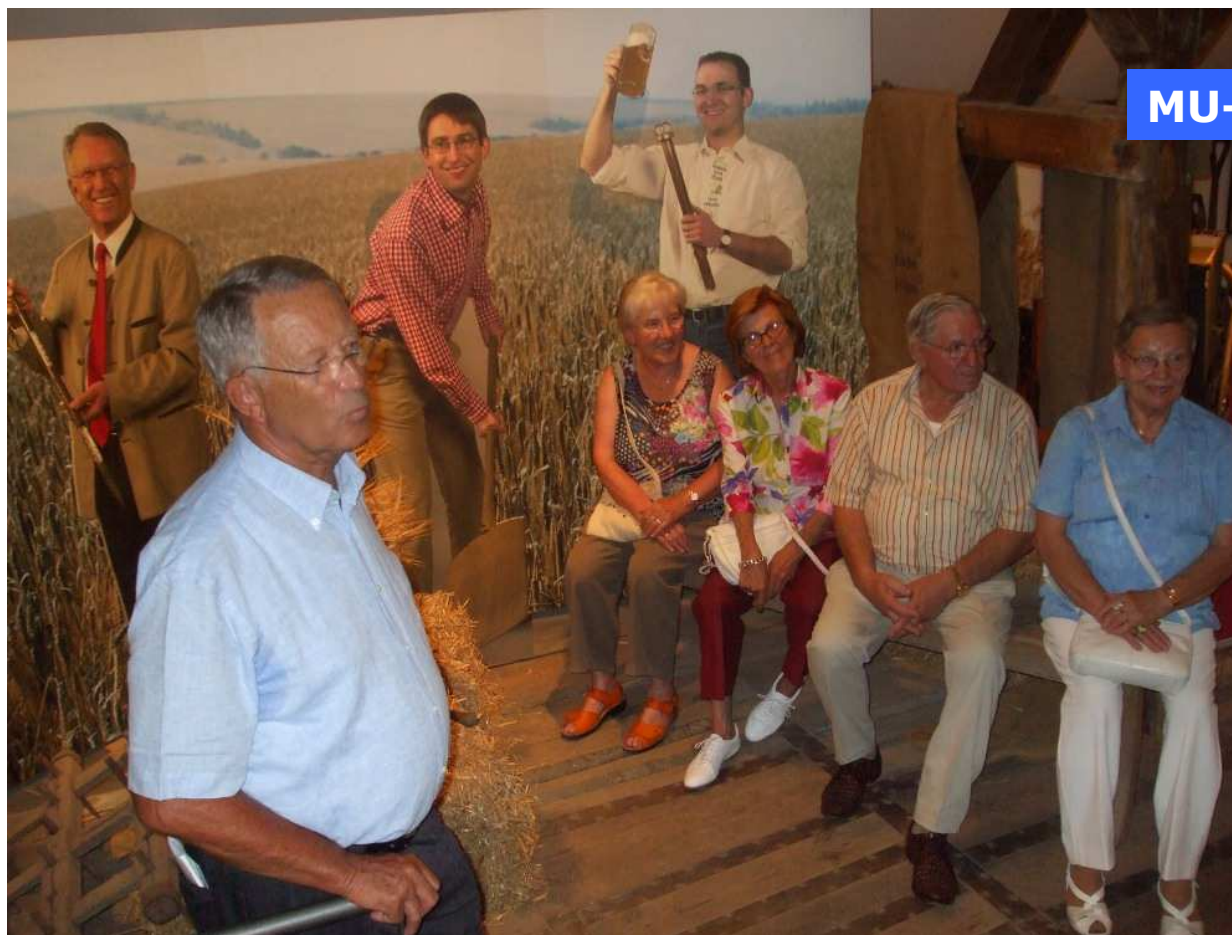
Sommerfest " Mittelstand besucht Mittelstand" Freitag, 16.07.2010 Steinbachbräu, Erlangen