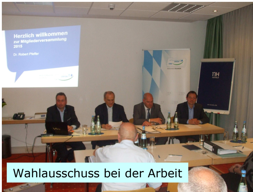
Wahlausschuss bei der Arbeit