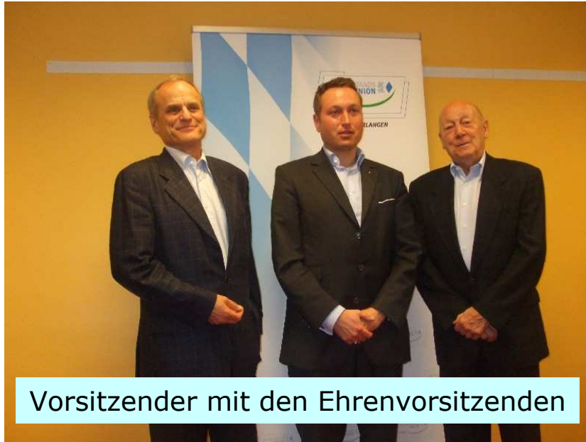
Vorsitzender mit den Ehrenvorsitzenden