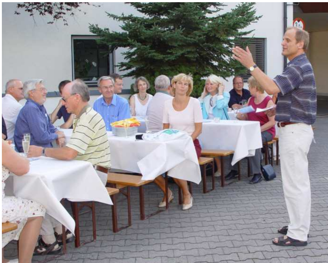
MU-Sommerfest - „Mittelstand besucht Mittelstand“ 21. Juli 2006 bei bad & heizung Dreyer