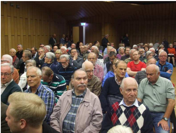
Infoveranstaltung vom 11.11.2015 der Stadt Erlangen zur Straßenumlaufbahn (StUB)