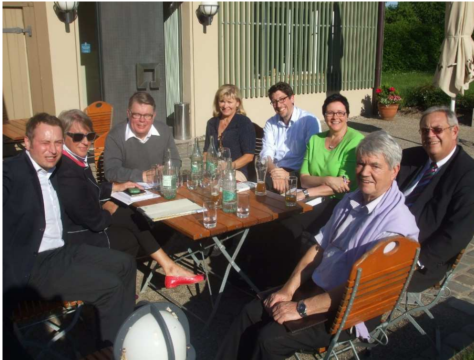
konstituierende Sitzung im Freien