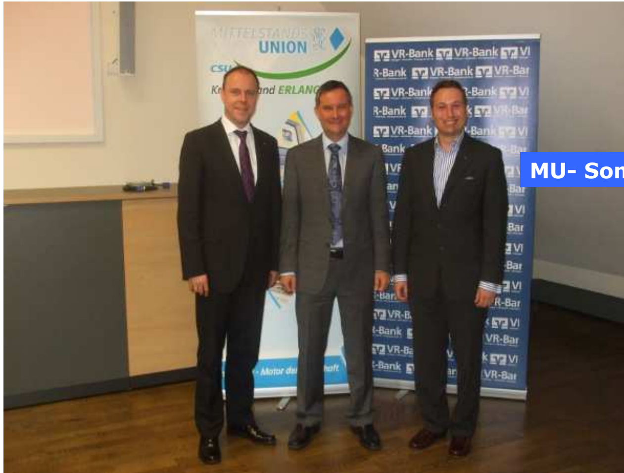
Sommerfest "Mittelstand besucht Mittelstand" Freitag, 06.Juli 2012 VR Bank, 91052 Erlangen, Nürnbergerstraße 64/66