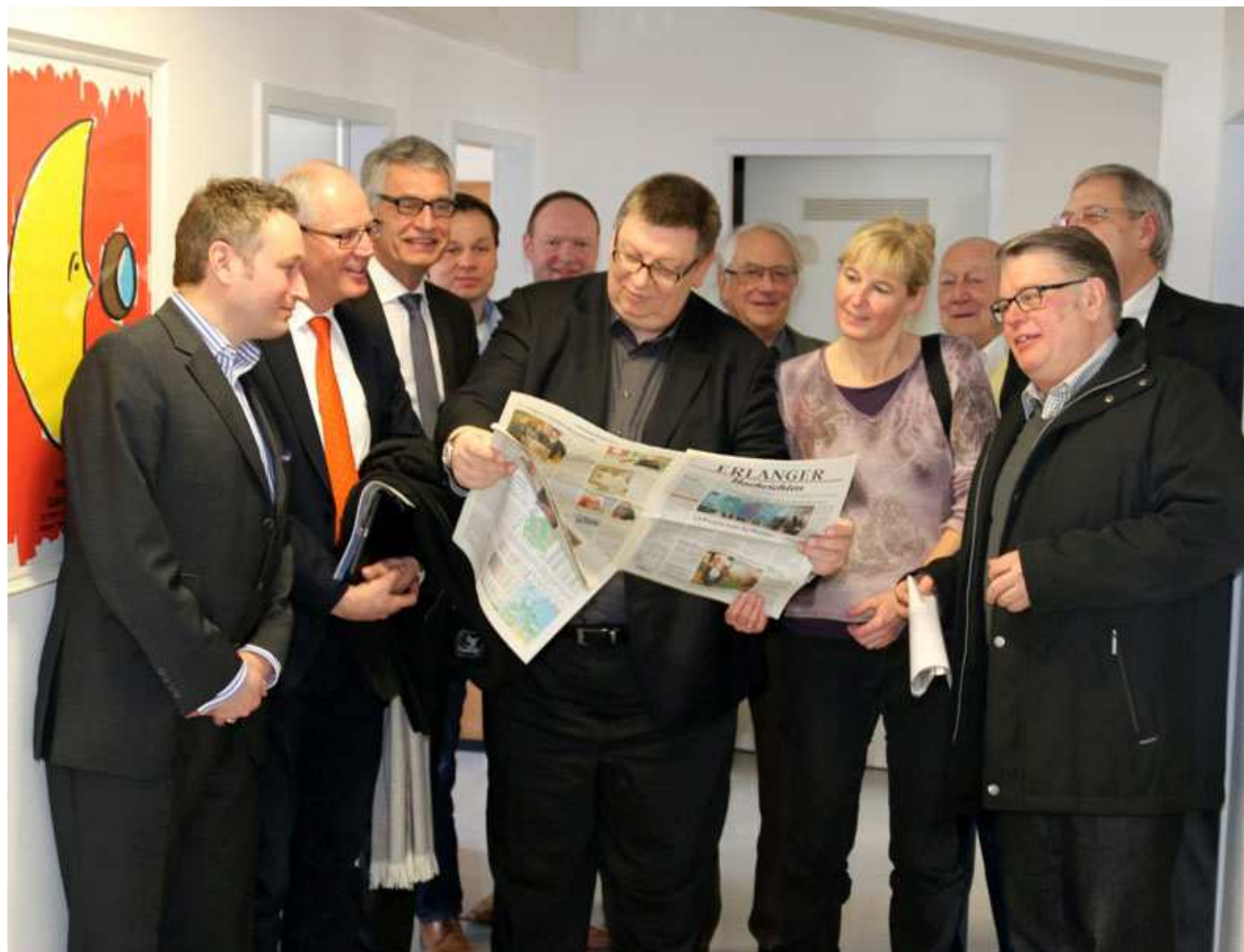
Besuch der Redaktion der Erlanger Nachrichten 25. Februar 2015